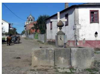
Rua de Baçal