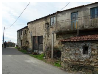
Rua em Constantim