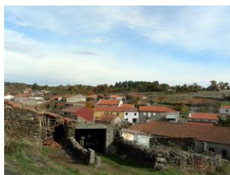
Vista geral de Constantim