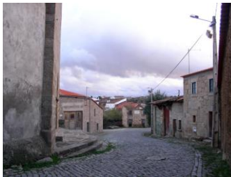
Rua em Duas Igrejas