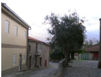
Rua em Duas Igrejas